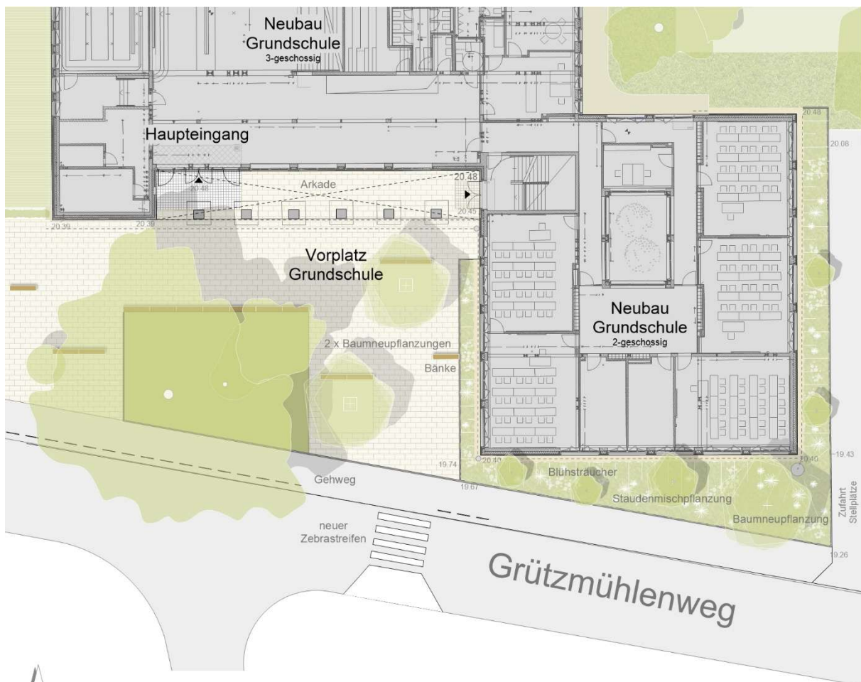
Abb. 3: Neue Eingangssituation der Grundschule mit adressbildender Vorplatzgestaltung

Mit dem Abriss des alten Verwaltungsgebäudes und dem Neubau der Grundschule verändert sich das Erscheinungsbild am Grützmillenweg. Der Haupteingang der Grundschule wird näher zur Kreuzung Grützmillenweg / Hummelsbüttler Hauptstraße verlegt, die markante Eiche bleibt erhalten. Der neue Eingangsbereich ist über einen ansteigenden Weg und Arkaden erreichbar. über.