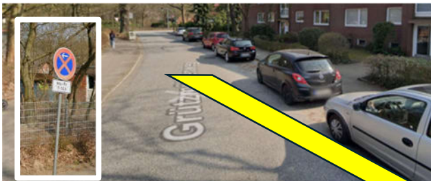
Abb. 2: Halteverbotszone während der Bauzeit (Mo - Fr / ganztägig)

Das Parken auf der Fahrbahn ab der Kreuzung Grützmühlenweg / Hummelsbüttler Hauptstraße ist während der Bauzeit werktags ganztägig verboten, um Grundstückszufahrten freizuhalten. Ein Anspruch auf Parkraum direkt vor der Haustür für alltägliche Bedarfe von Pflegedienstleistungen, Essensanlieferung, oder Krankentransporten besteht grundsätzlich nicht. Für besondere Nutzungen wie Baustelleneinrichtungen kann nach entsprechendem Antrag auf straßenverkehrsbehördliche Anordnung und Prüfung der Verträglichkeit mit dem Anlieferverkehr eine solche Fläche bewilligt und durch den Antragsteller entsprechend der Genehmigung abgesperrt werden